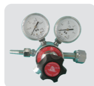
专用 CO 2 减压阀